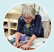
日本臨床美術協会資格認定会員 臨床美術士