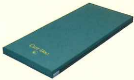
マットレス (1枚) (2層式 1枚)